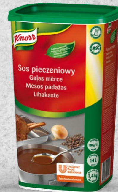
SOS PIECZENIOWY KNORR 1,4 KG